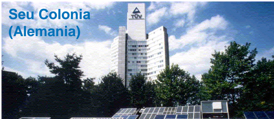
Seu Colonia (Alemania)