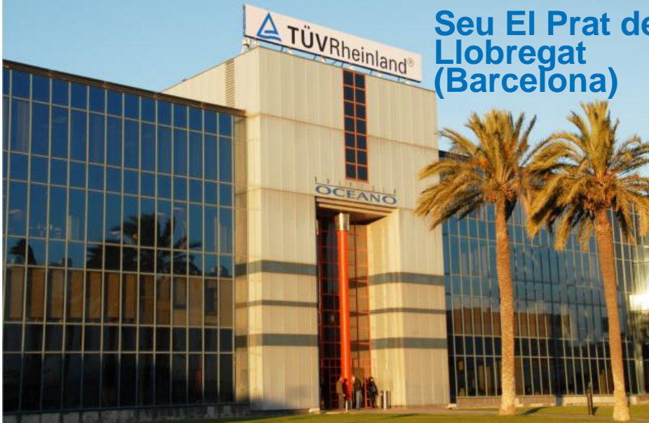
Seu El Prat de Llobregat (Barcelona)