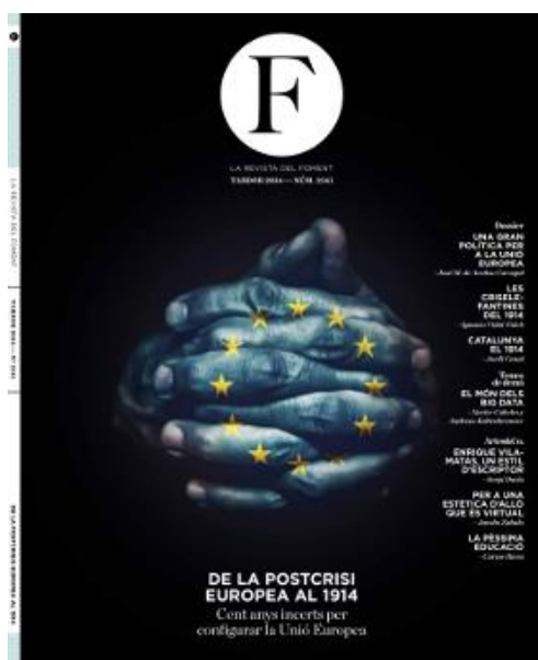
Portada del número 2.141, primer de la nova època

Foment del Treball Nacional és la confederació que representa des de 1771 els empresaris i la potent indústria catalana. Com a institució estretament arrelada a la societat civil de Catalunya i d'Espanya, Foment es compromet amb el progrés econòmic i humà també a través de la promoció del coneixement i de la seva difusió com a garantia de progrés. Foment treballa també per vindicar el valor social de l'empresari a través de l'aportació que la seva tasca fa al conjunt de la societat.