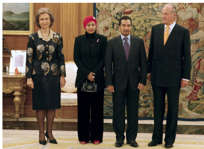
SS MM los reyes de España, junto a SS MM los reyes de Malasia, durante la visita oficial que realizaron a España, en octubre de 2008.