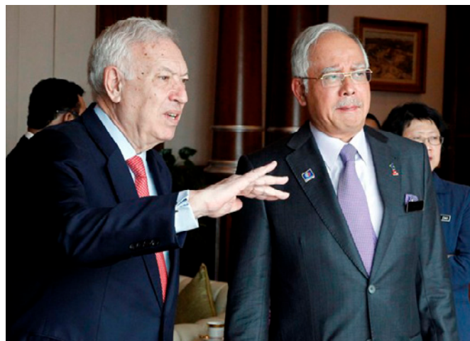
El anterior ministro de AA.EE y de Cooperación José Manuel García-Margallo, junto al entonces primer ministro de Malasia, Najib Razak, durante su visita a Kuala Lumpur en marzo de 2014.

Está casado con S.A.R. Tunku Azizah (nombre oficial: Her Majesty Raja Permaisuri Agong, Tunku Hajah Azizah Aminah Maimunah Iskandariah Binti