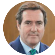
Antonio Garamendi Presidente de CEOE

Con la presentación de este catálogo de propuestas, las empresas españolas ratificamos nuestro compromiso con España, asentado siempre en tres señas de identidad inequívocas: independencia, sentido de Estado y lealtad institucional.